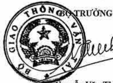
Nguyễn Văn Thế

8 Điều 2 và Điều 3 của Thông tư số 49/2018/TT-BGTVT sửa đổi, bổ sung một số điều của Thông tư số 35/2012/TT-BGTVT ngày 6 tháng 9 năm 2012 của Bộ trưởng Bộ Giao thông vận tải quy định về lắp đặt báo hiệu kilômét - địa danh và cách ghi ký hiệu, số thứ tự trên báo hiệu đường thủy nội địa, có hiệu lực kể từ ngày 01 tháng 01 năm 2019 quy định như sau: